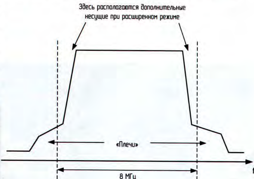
Рис. 2. Расширенный режим

Следующая «хитрость», позволяющая увеличить защищенность от помех – это перемежение по времени. Для того чтобы понять, что такое перемежение, рассмотрим следующий наглядный пример.